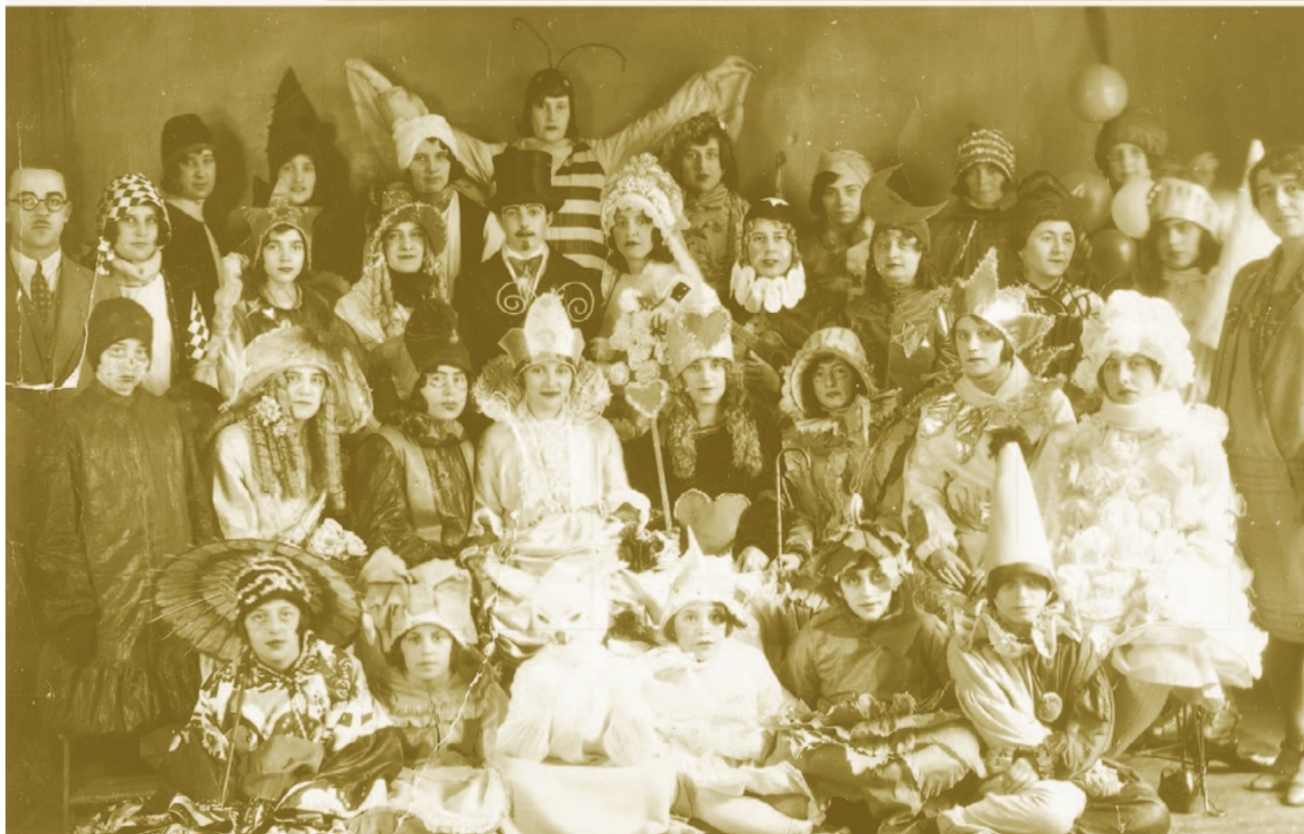
Un soir de mascarade avant le départ pour la patinoire.

Dans les années 20, selon que vous demeuriez dans une partie du village ou dans l'autre, il y avait une patinoire à la disposition des gens. Les gens du village descendaient la côte de l'Église pour se rendre soit sur la rivière, soit sur le site actuel de l'hôtel de ville, selon que la glace soit prise, pour s'adonner au patinage ou au hockey. Les gens de la campagne eux pratiquaient les mêmes activités sur une patinoire située à l'arrière des maisons de la rue Letendre.